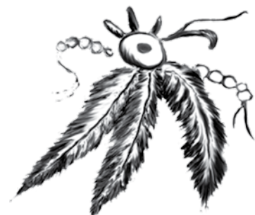
Simeone vetri d'arte